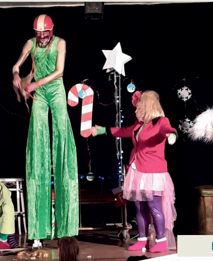
CIE DESSOUS DE SCENE

GOÛTER ET SPECTACLE DE THEATRE AVEC FICELLE ET GRATON