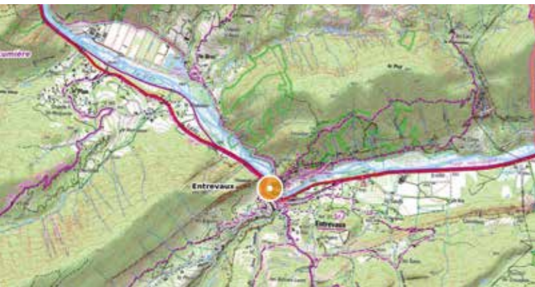
La carte donne un aperçu des nombreux sentiers balisés (marqués en rose).

Pour une simple promenade ou une randonnée à la journée, les chemins à parcourir sont multiples au départ d'Entrevaux.